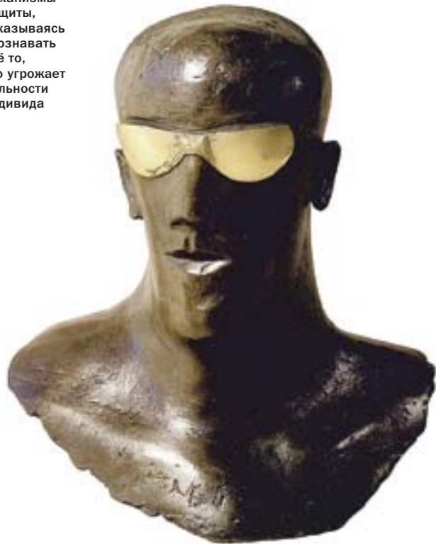
Дейм Элизабет Фринк Голова в защитных очках 1969

«Я» создает механизмы защиты, отказываясь осознавать всё то, что угрожает цельности индивида