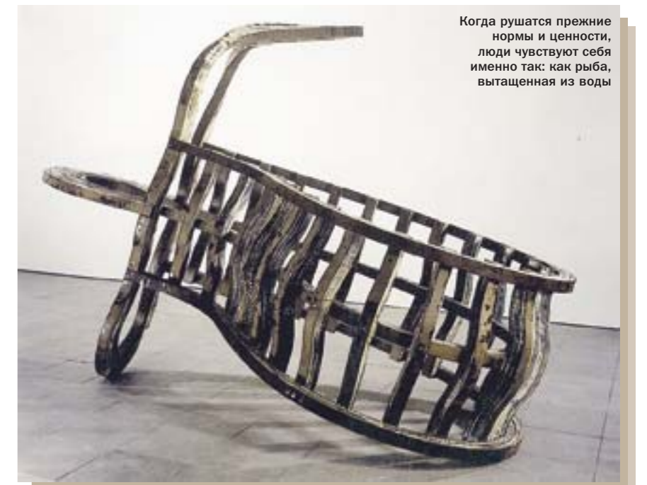
Когда рушатся прежние нормы и ценности, люди чувствуют себя именно так: как рыба, вытащенная из воды

Ричард Дикон Рыба, вытащенная из воды 1986–1987