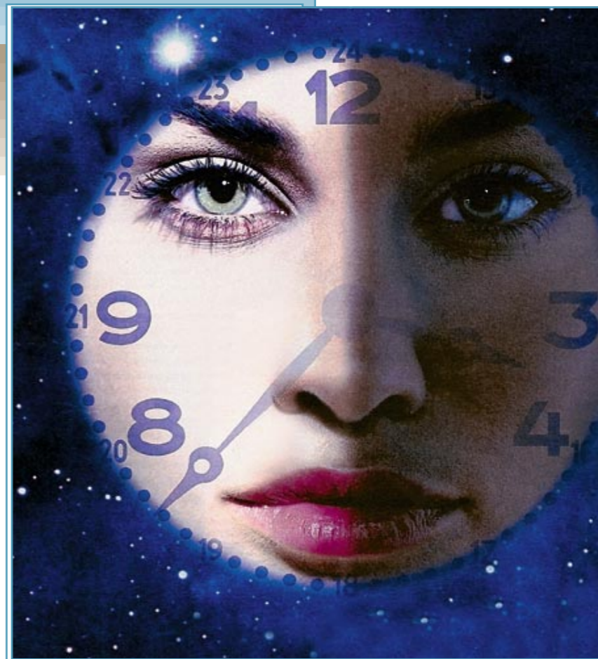
Часы нашего сна

Небольшая мутация гена, получившего прозвище «ген Тэтчер» в честь бывшего британского премьер-министра, которая славились сво-