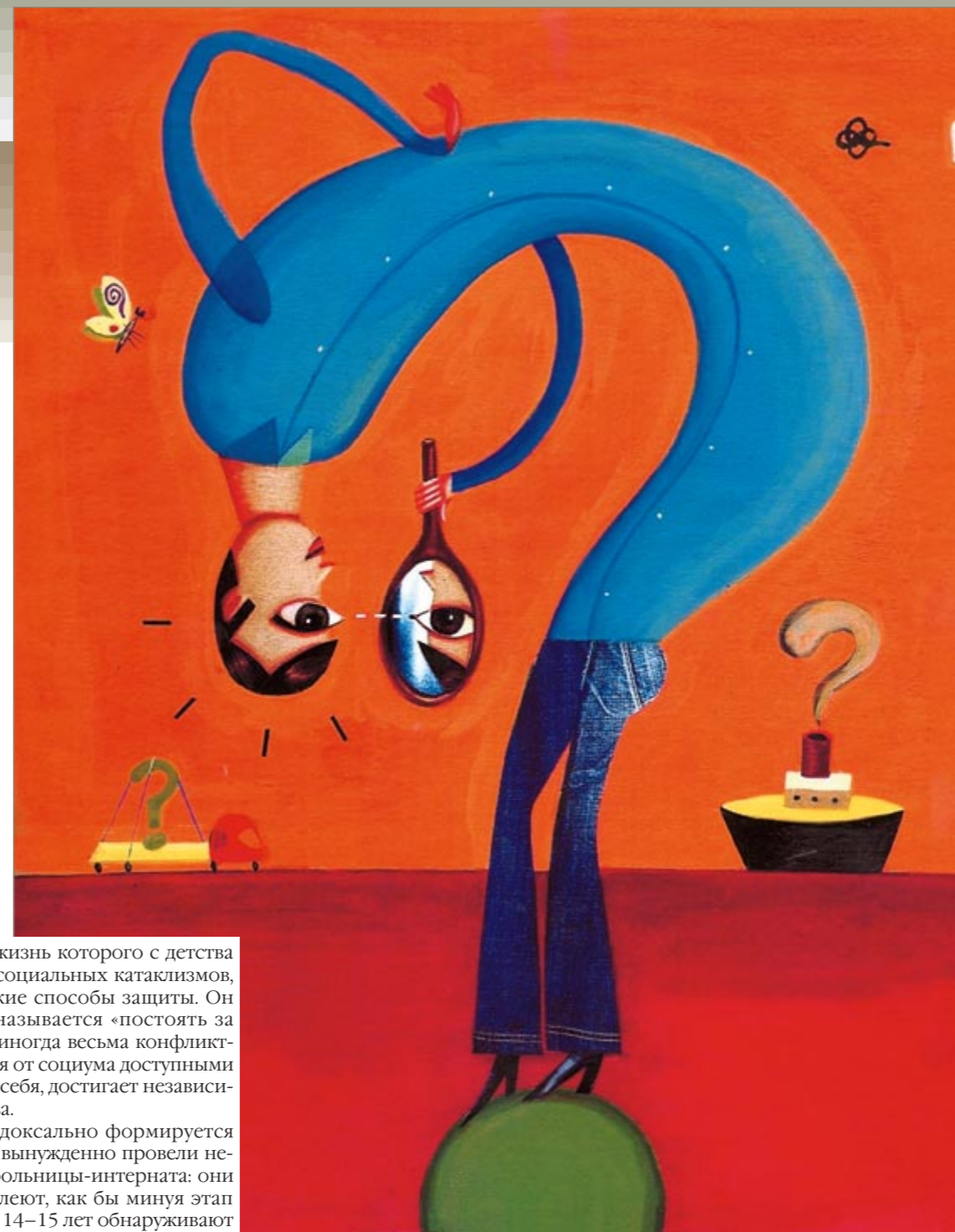
Рисунок из журнала «Focus»

Ясно, что человек, жизнь которого с детства протекает в обстановке социальных катаклизмов, вырабатывает в себе некие способы защиты. Он либо учится тому, что называется «постоять за себя», причем в формах иногда весьма конфликтных, либо отгораживается от социума доступными ему средствами, уходит в себя, достигает независимости ценой одиночества.