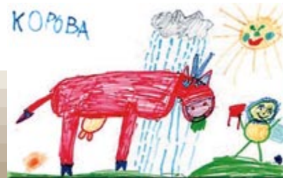
Галерея детского рисунка: «Корова». Рисунок Настеньки Егошиной из Москвы