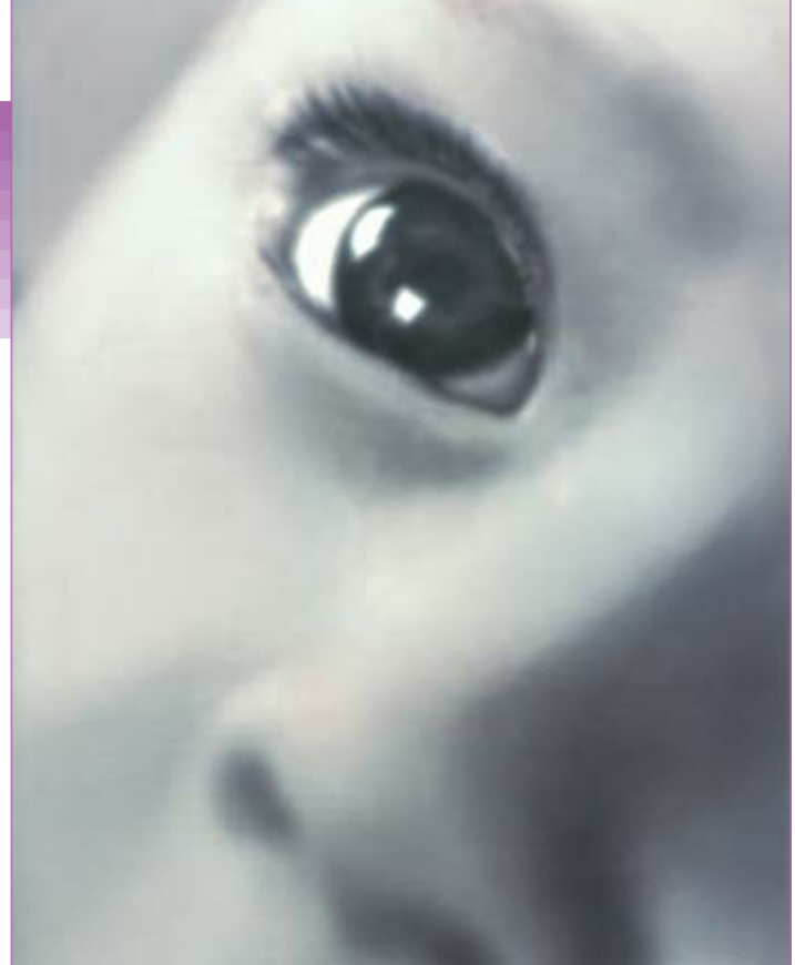
Такой выразительный глаз

Проведенное исследование свидетельствует о том, что люди рождаются уже с «социальным мозгом», иными словами, готовым принимать стимулы извне, взаимодействовать, воспринимать опыт, обучаться.